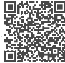
相關表單 QR Code

https://drive.google.com/drive/folders/1sU3zo20F0TMJ3D29bDpDkYsjq122h6KR?usp=sharing